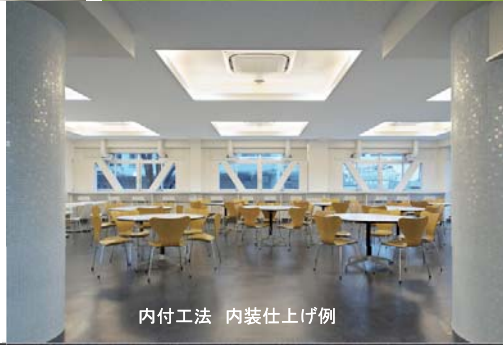
内付工法 内装仕上げ例

本工法は、工事中の騒音や振動、粉塵を軽減できる特長を生かしながら、病院や学校あるいは事務所建築を中心とした、居ながらの耐震補強工事を可能としました。